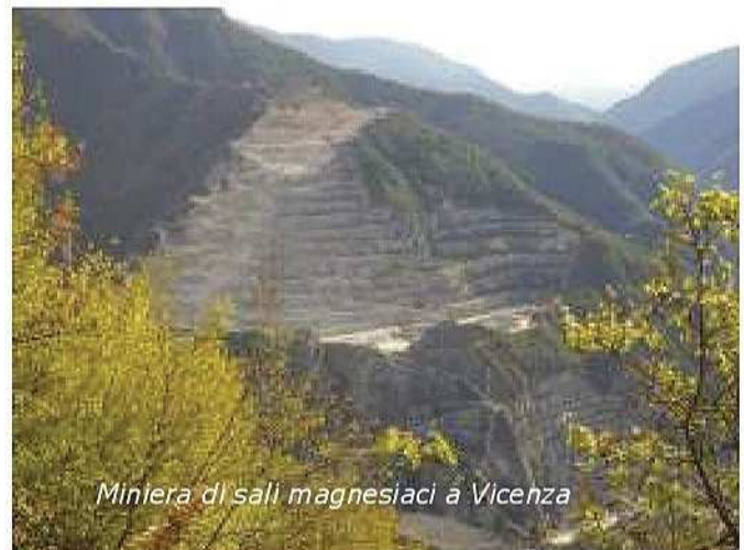
Miniera di sali magnesiaci a Vicenza